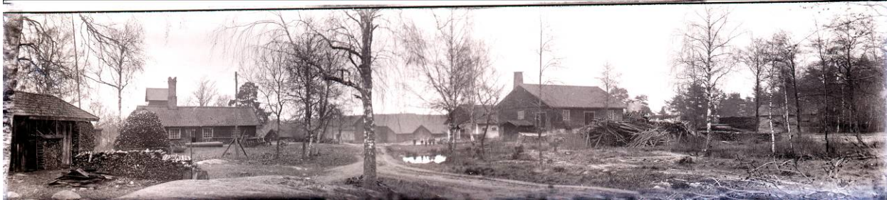
Gamlegården 1933 .... På fotot ser man bla. gamla smedjan med hög skorsten och där bakom transformator-huset .. till höger sågen.