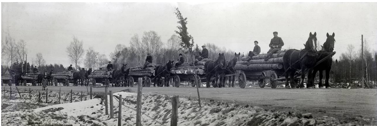
Stockar på väg till sågen